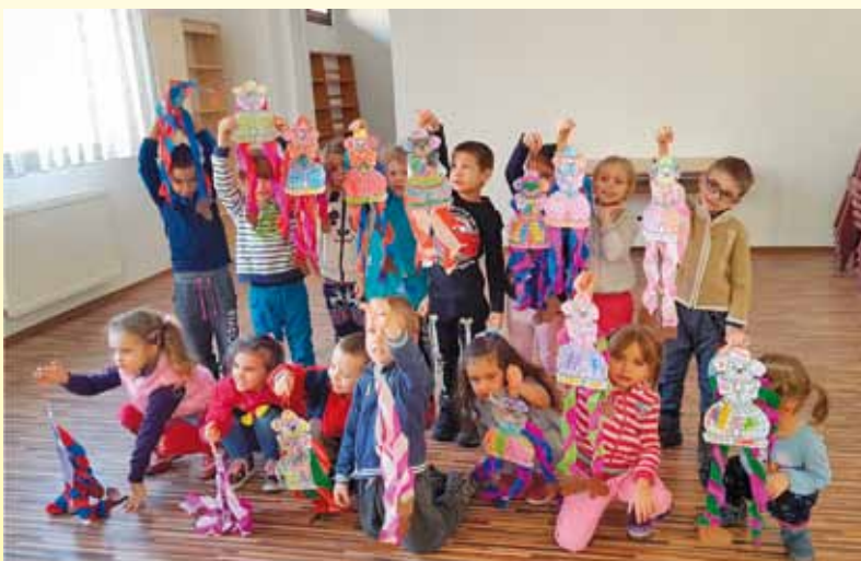
Bohóc készítés a művelődési házban