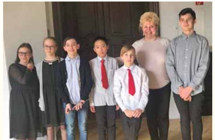
Egri országos zongoraverseny indulói