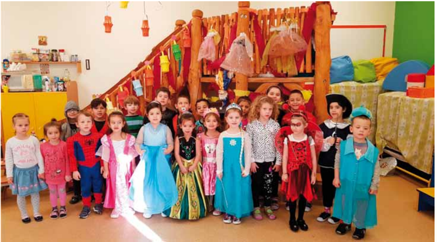
Farsang az oviban