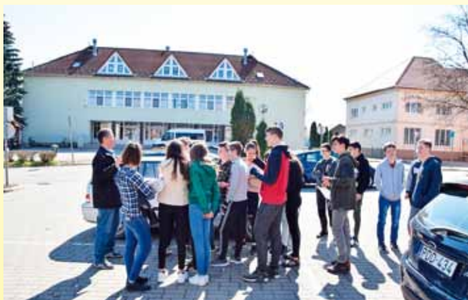
Fenntarthatósági Témahét a Bárkányiban