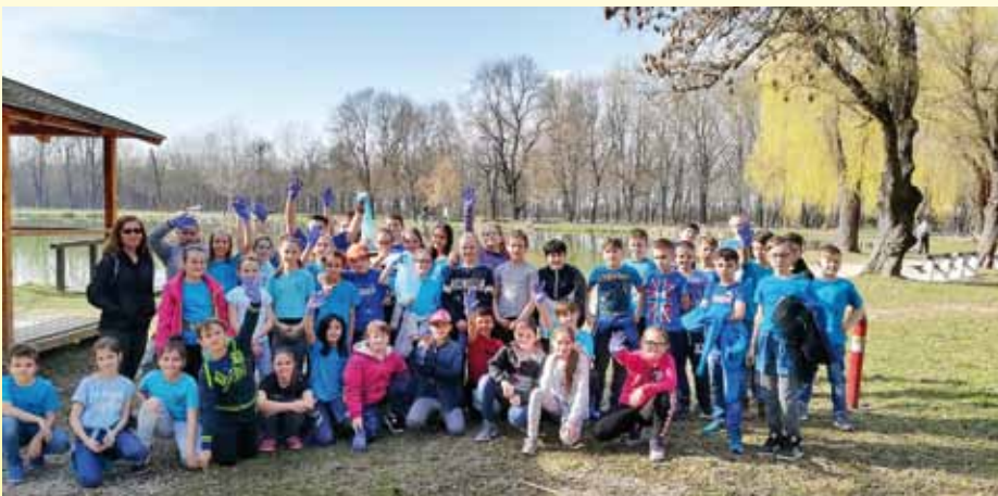
A Víz Világnapja

A PontVelem Nonprofit Kft szervezésében lett meghirdetve a Fenntarthatósági Témahét, melyhez az ország számos iskolája mellett iskolánk is csatlakozott. A szervezők több mintaprojekt lehetőségét kínálták fel a szaktanárok számára, akik dönthettek, melyiket szeretnék a gyerekekkel megismertetni. Szécsényben a levegőszennyezés került kiválasztásra. Két osztály – a 8.A és a 8.B – tanulói játékos körülmények között végeztek el olyan egyszerű feladatokat, amellyel sikerült felhívni a figyelmüket arra, hogy a Föld és annak természeti értékei nem a mai ember privilégiuma. Úgy kell vele gazdálkodni